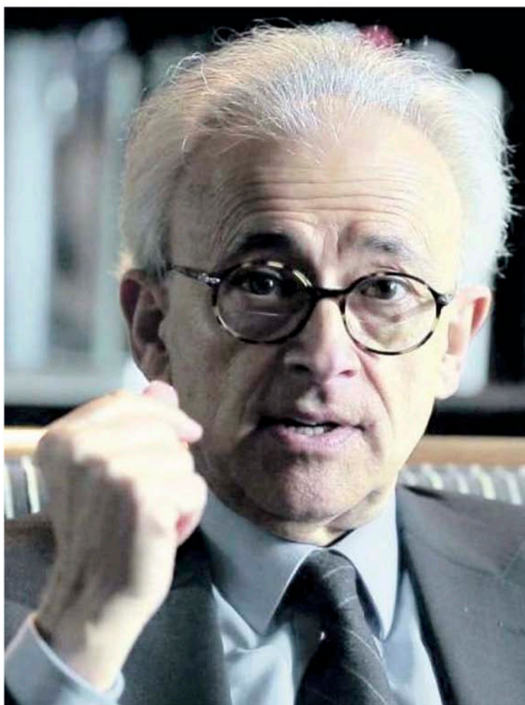
ANTONIO DAMASIO Appuntamento venerdì alle 21 al centro congressi Kursaal di Lignano con uno dei più influenti studiosi a livello mondiale nel campo delle scienze biomediche