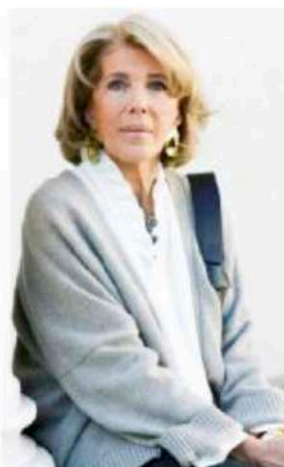
La grecista Eva Cantarella

maledette» su Rai3, il Premio Speciale Hemingway 2019 «Dentro la cronaca, dentro la vita», assegnato nel 60° dall'istituzione del Comune. I vincitori sono stati annunciati ieri. La 35esima edizione del premio intitolato allo scrittore statunitense Ernest Hemingway (1899-1961), richiama la capacità del grande autore americano di guardare nel profondo dell'animo umano. Un filo rosso accomuna le scelte 2019, come appare dalle motivazioni: lo scrittore Carrère, «capace di restituire con vividi ritratti le pieghe sfaccettate di personaggi attinti anche dalla ambigua