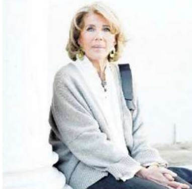
PREMI HEMINGWAY A Lignano Sabbiadoro riconoscimenti per lo scrittore francese Emmanuel Carrère e la storica Eva Cantarella nelle sezioni Letteratura e Avventura del pensiero